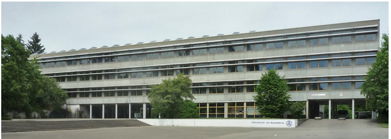
Villingen-Schwenningen: Gymnasium am Deutenberg – Brandschutzfachplanung