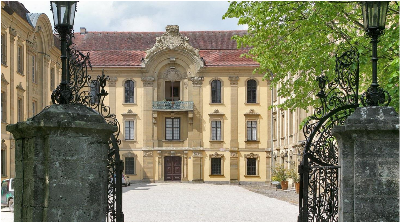
Schillingsfürst | Schloss