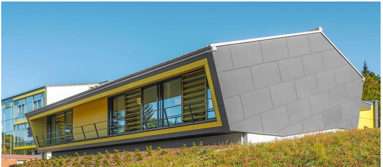
Feuchtwangen: Neubau Mensa

Was Sie nach der Einarbeitungszeit darüber hinaus erwarten können: