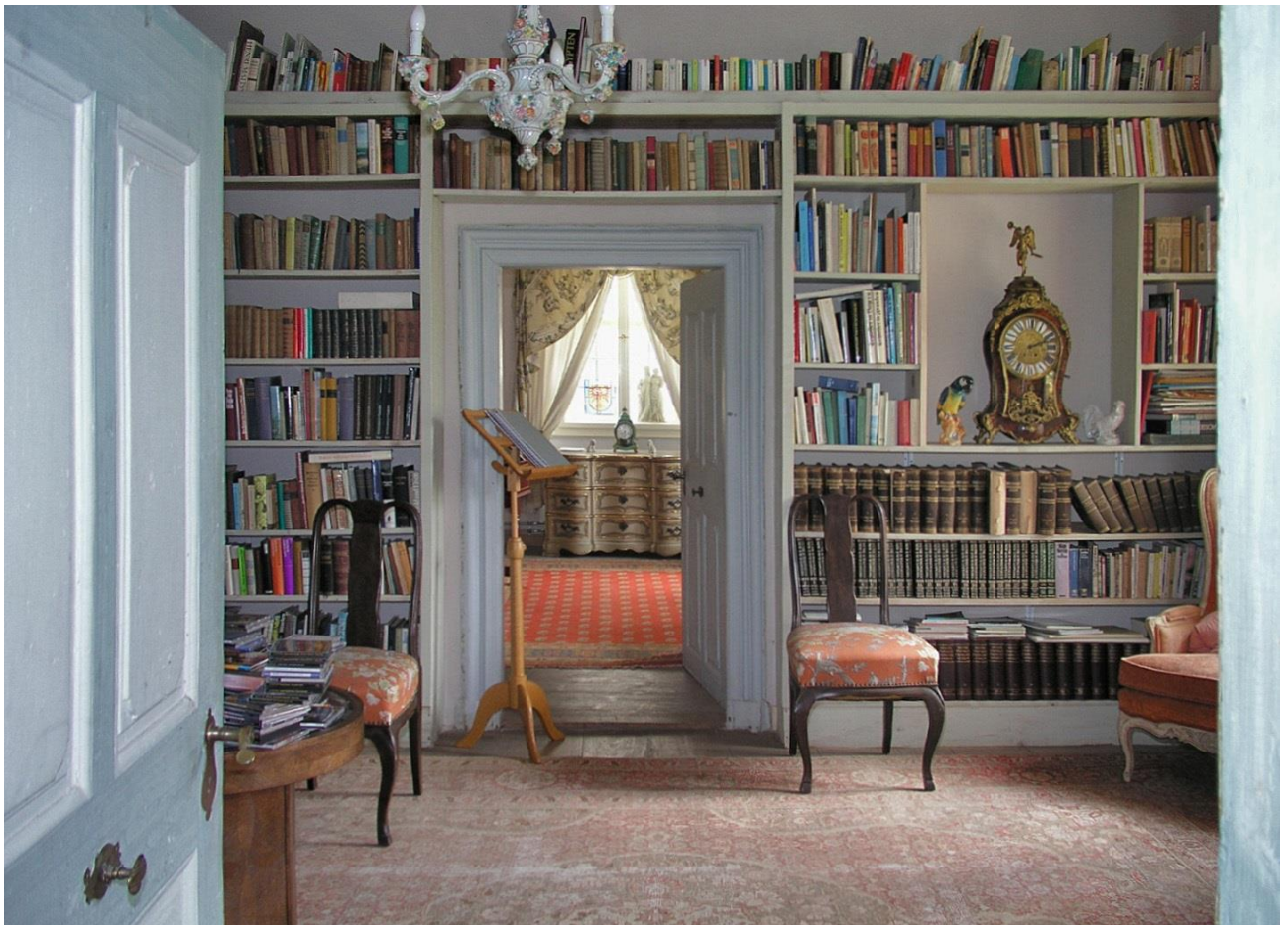
Markt Nordheim | Schloss Seehaus

Ihnen ist folgendes genauso wichtig wie uns: