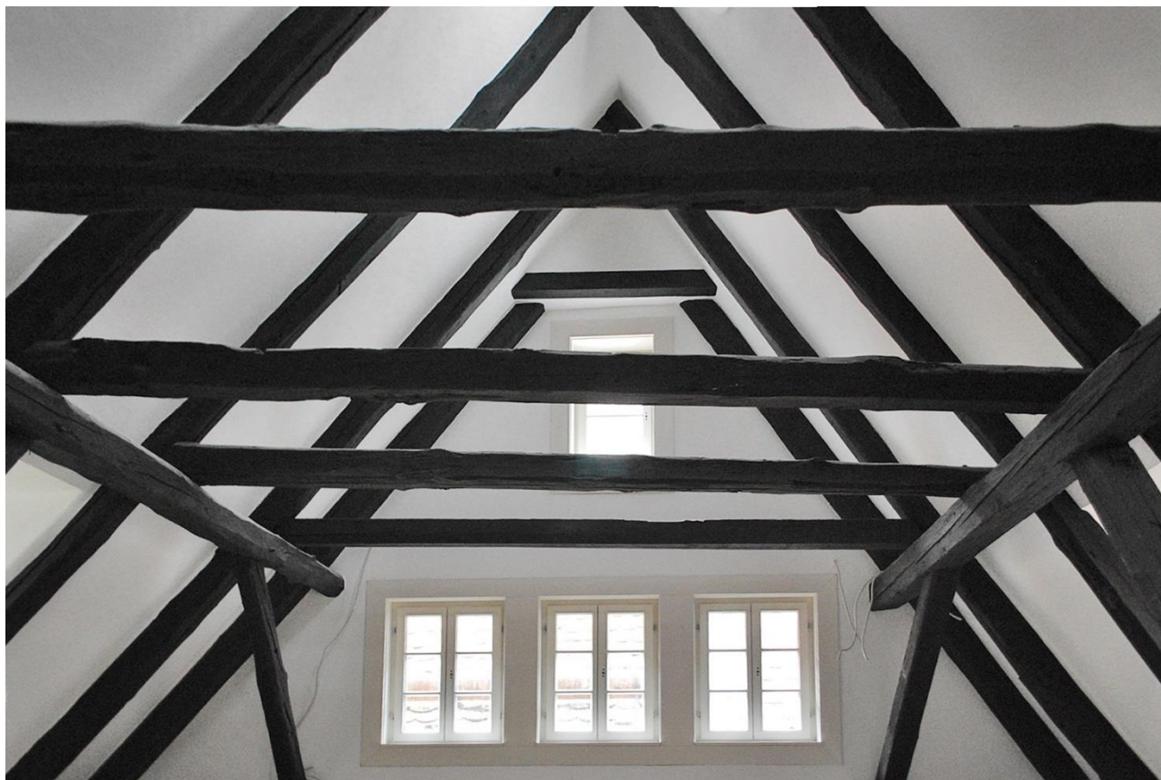
Rothenburg o.d.T.: Bürgerhaus 15.Jh