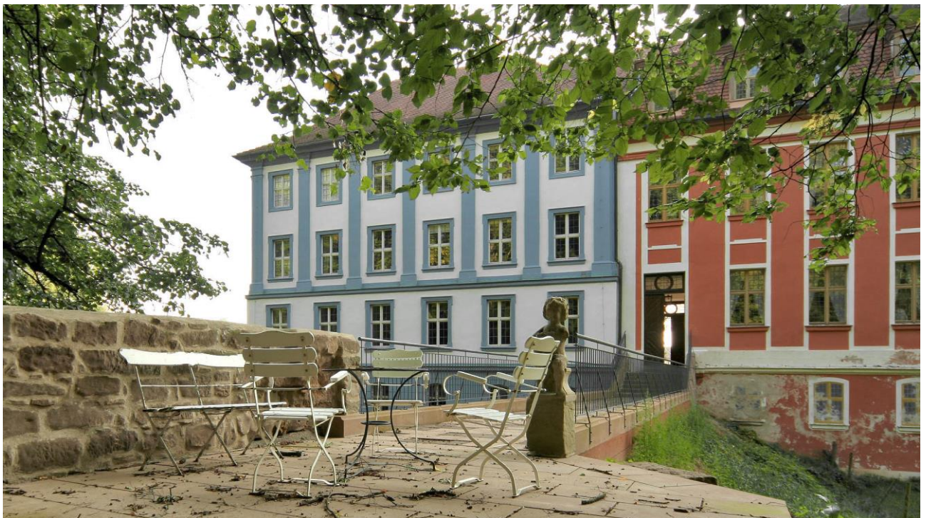
Oberzenn: Blaues und rotes Schloss (Laufendes Projekt)