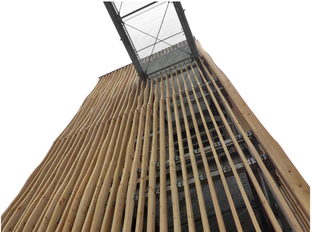
Bad Neustadt a. d. Saale: Fluchttreppenturm Mittelschule